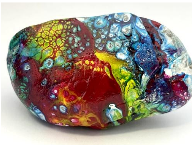
Nachher mit deutlich besserer Ausleuchtung