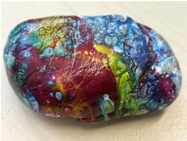
Vorher mit Reflektionen und ungünstigem Licht

So, nun kannst du mit dem Fotografieren deiner Objekte beginnen und hier noch der Unterschied vorher/nachher: